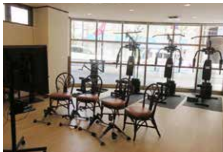
筋トレと脳トレを交互に行うシニアジム

愛知県内で「だいたい薬局」7 店舗や健康教室、生活支援事業を 展開する「シセイ」(名古屋市天白 区)が、本部のある原駅・バスター ミナル前のビル「エスタシオン 21」1階に、カフェ「あじゃすと」 を併設した脳と体を鍛えるシニ アジム「だいたいトータルライフ