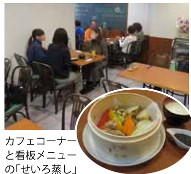
カフェコーナー と看板メニュー の「せいろ蒸し」

カフェではモーニングタイ ムにワンコインのモーニング メニューやこだわりの「玉子か けご飯」などを、ランチタイムに はせいろ蒸しや薬膳キーマカ レ、各種スイーツなどを提供 する。日曜のみ休業。